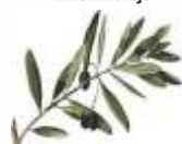
CPR de Almendralejo